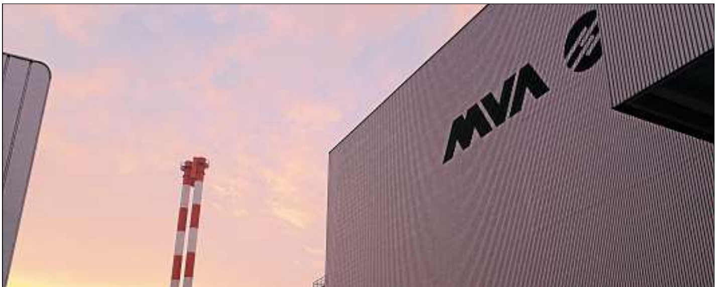
Riesiger Filter: Die Rauchgasreinigung der MVA entfernt 99 Prozent der bei der Verbrennung freigesetzten Schadstoffe.