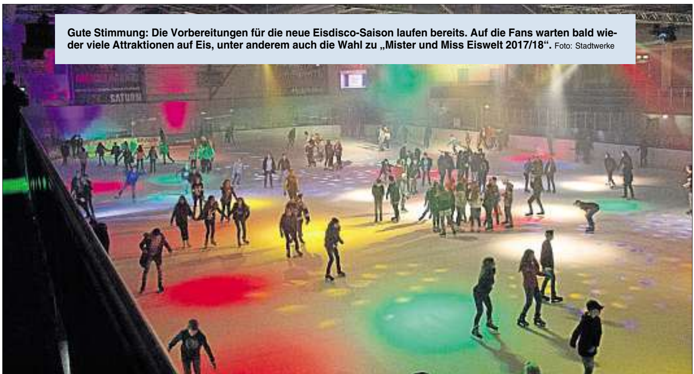
Gute Stimmung: Die Vorbereitungen für die neue Eisdisco-Saison laufen bereits. Auf die Fans warten bald wieder viele Attraktionen auf Eis, unter anderem auch die Wahl zu „Mister und Miss Eiswelt 2017/18“.

Während man in Ingolstadt die ersten Sonnenstrahlen im Café bei einem leckeren Eisbecher genießt, hat das Team der Eisdisco Ingolstadt eine ganz andere Art von Eis im Kopf: den eiskalten Untergrund für die beliebte Attraktion auf Schlittschuhen. Denn die Planungen für die neue Eisdisco-Saison sind bereits in vollem Gange. Im Verlauf der vergangenen Jahre konnte die Eisdisco jedes Jahr neue Besucher gewinnen. Und auch in der neuen Saison 2017/18 sollen viele kleine Highlights nicht nur die Stammgäste sondern auch viele neue interessierte Eisprinzessinnen und Schlittschuh-Rocker in das knallbunt beleuchtete Eisstadion locken.