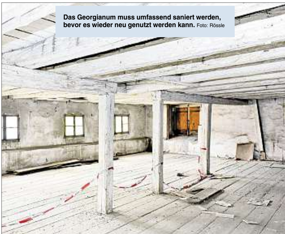
Das Georgianum muss umfassend saniert werden, bevor es wieder neu genutzt werden kann.

Die Planungen zur denkmalgerechten Sanierung und neuen Nutzung des historischen Georgianums gehen weiter voran. Nach der Vorstellung der Machbarkeitsstudie und der einstimmigen Entscheidung des Stadtrates für das neue Nutzungskonzept im vergangenen Herbst, tritt das Projekt jetzt in die nächste Realisierungsphase. Im Mai hat der INKoBau-Aufsichtsrat bereits die weiteren Entscheidungen und den Zeitplan diskutiert, im Juli erfolgt die Verabschiedung des Konzepts durch den Stadtrat. Anschließend kann gleich ein Architekturbüro gesucht und noch im Spätherbst beauftragt werden. Dieses Büro soll bis Juli 2018 konkrete Sanierungspläne und eine Kostenberechnung vorlegen. Darauf aufbauend können die konkreten Arbeiten ausgeschrieben werden.