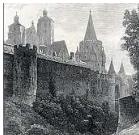
Das Stadtarchiv sucht weiterhin Aufnahmen der historischen Stadtmauer.