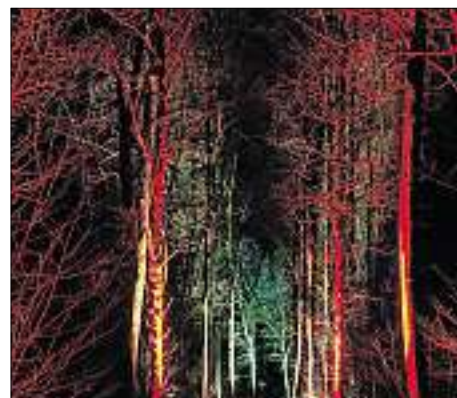
Der Stimmungsvoll beleuchtete Auwald.

Auch für den Menschen wurde einiges getan. Im Auenzentrum im Jagdschloss Grünau informierten sich schon mehr als 100 000 Interessierte über die Bedeutung der Flussaue. Regelmäßig gibt es Ausstellungen und Sonderschauen, noch bis 20. Mai sind 22 beeindruckende Aufnahmen von Insekten und Amphibien im Rahmen der Wanderausstellung „Natur im Fokus“ zu sehen. Ideal für einen Spaziergang oder Radlausflug sind die Themenwege, von denen es inzwischen sechs verschiedene gibt. Informative Tafeln verraten auf dem Weg alles Wissenswerte zu den Stationen. Dabei geht es zum Beispiel auch zur Ingolstädter Staustufe und dem nahe gelegenen Donaupavillon. Als besonderes Schmanckerl gab es zuletzt einige Nachtführungen unter dem Motto „Der Auwald in einem anderen Licht“. Dabei wurde ein Themenweg stimmungsvoll beleuchtet (Foto) und zeigte den Wald so, wie ihn die Besucher sicher noch nie gesehen hatten.