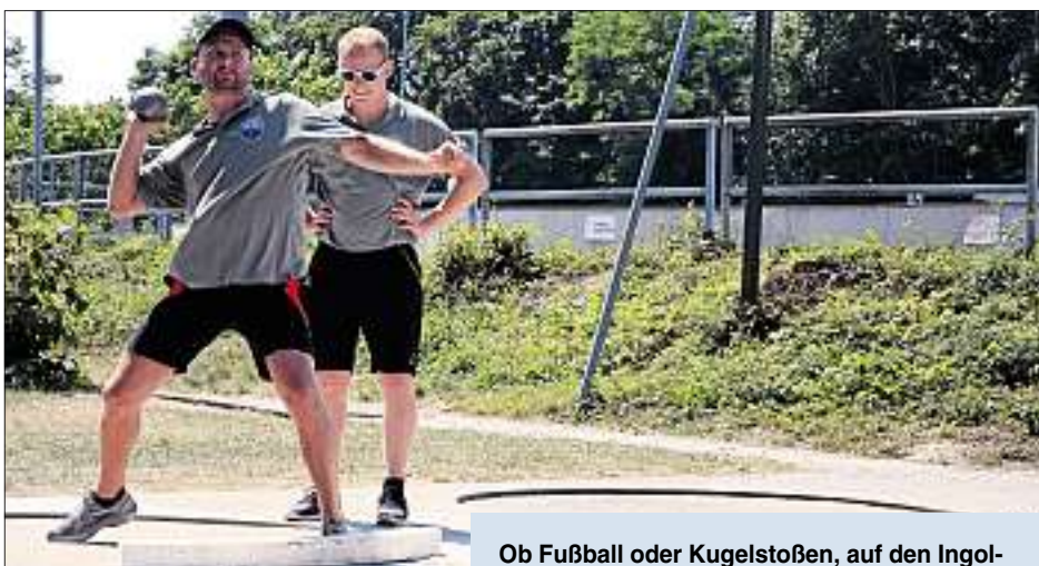
Ob Fußball oder Kugelstoßen, auf den Ingolstädter Bezirkssportanlagen sind viele sportliche Aktivitäten möglich.