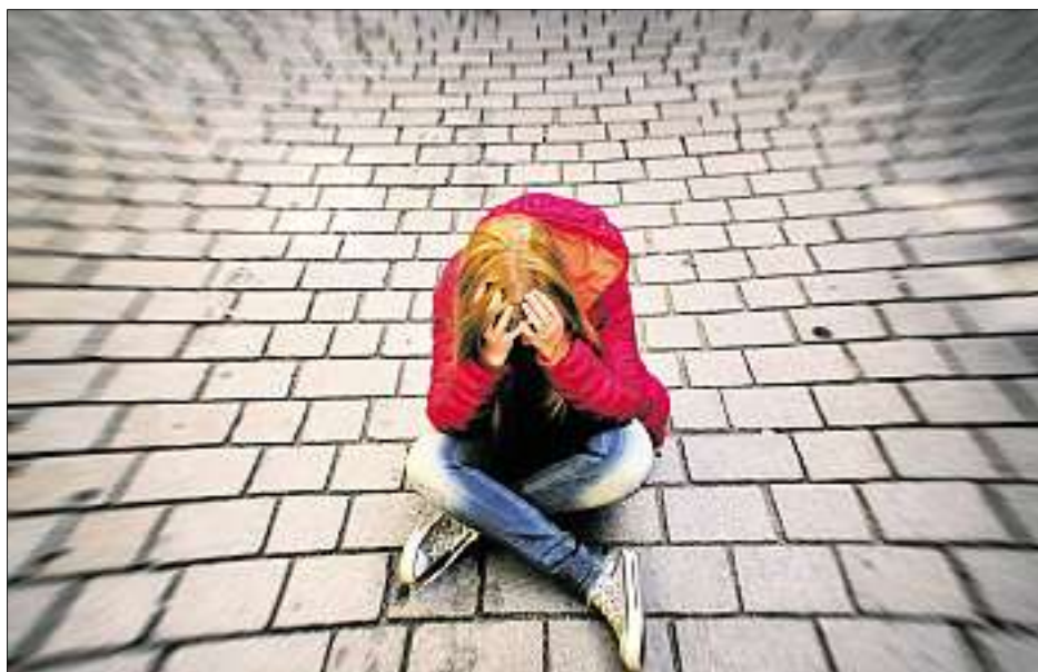
Unbegleitete jugendliche Flüchtlinge haben eine Menge mitgemacht. In der neuen Wohngruppe werden sie aufgefangen und rund um die Uhr betreut.

Die Jugendlichen kommen in einer Extremsituation zu uns, in der sie aufgefangen und bestmöglich betreut werden müssen. Sie müssen schnell Fuß fassen und sollen möglichst rasch eine Schule besuchen. „Ziel ist es, den Jugendlichen, die allein und völlig auf sich gestellt nach Deutschland kommen, ein Zuhause zu