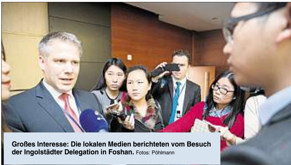
Großes Interesse: Die lokalen Medien berichteten vom Besuch der Ingolstädter Delegation in Foshan.