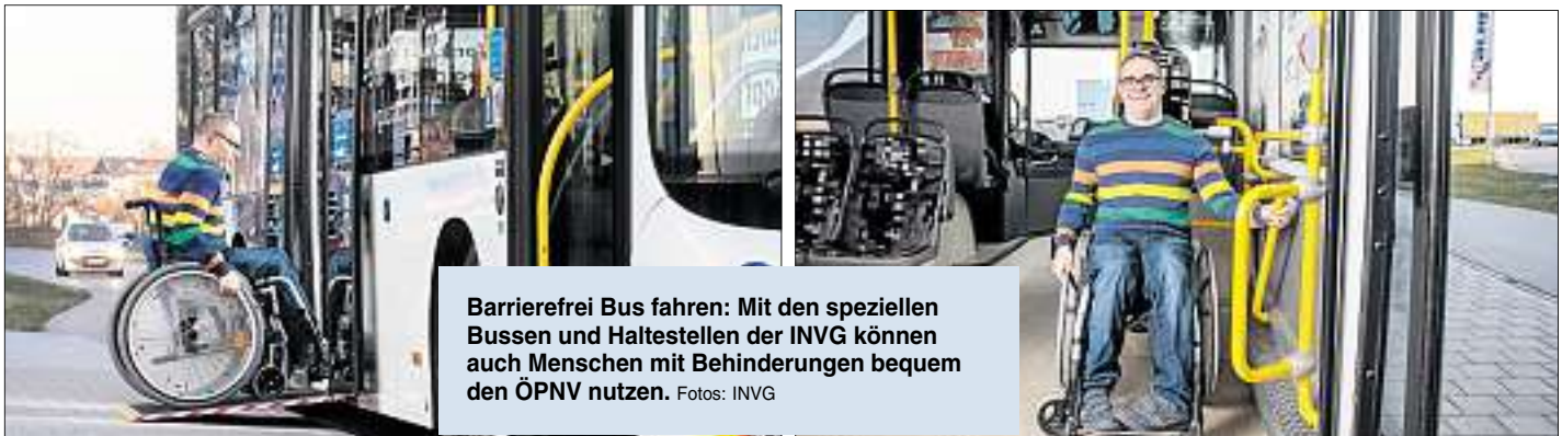
Barrierefrei Bus fahren: Mit den speziellen Bussen und Haltestellen der INVG können auch Menschen mit Behinderungen bequem den ÖPNV nutzen.

Barrierefreie, moderne und sichere Services für die Fahrgäste – die Ingolstädter Verkehrsgesellschaft (INVG) hat kräftig investiert, um Mobilität auch für die Menschen zu garantieren, die durch Alter, Krankheit oder Behinderung eingeschränkt sind. So können bereits mehr als 80 Prozent der INVG-Busse abgesenkt werden, um Fahrgästen mit Rollator oder Rollstuhl das Einsteigen an den Haltestellen zu erleichtern. Und Menschen mit eingeschränktem Sehvermögen wissen vor allem die neue Audio-Auskunft an den Haltestellen zu schätzen, die in gesprochener Sprache über Abfahrtszeiten informiert.