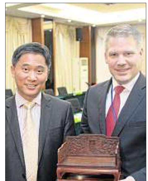
Kleine Geschenke erhalten die Freundschaft: Natürlich wurden auch landestypische Präsente ausgetauscht.