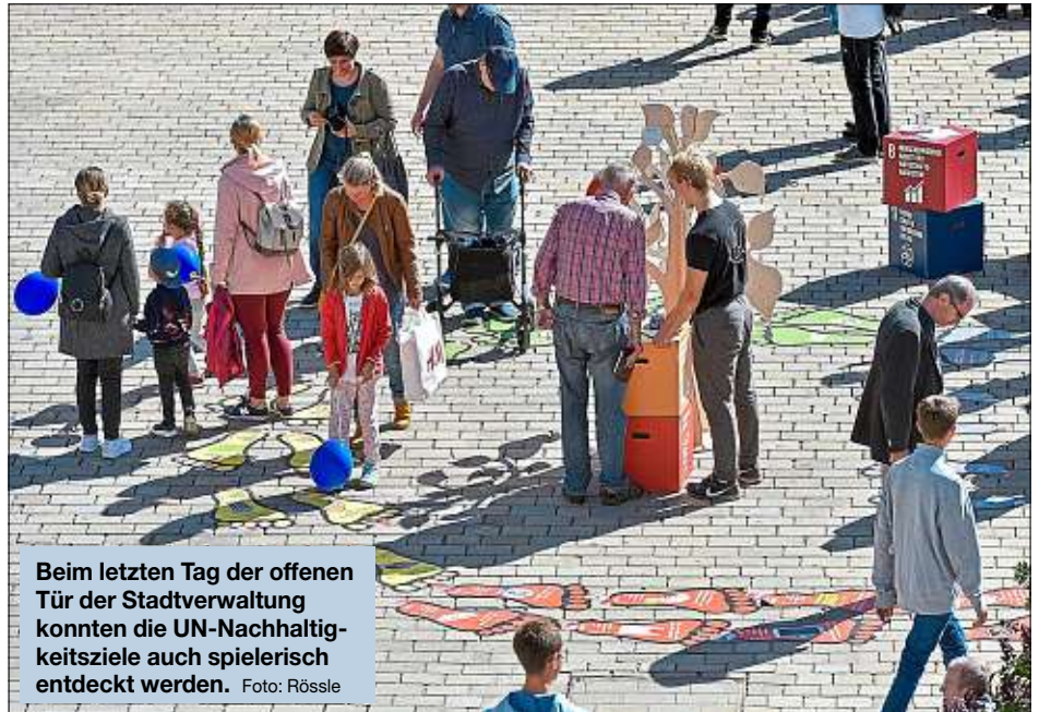
Beim letzten Tag der offenen Tür der Stadtverwaltung konnten die UN-Nachhaltigkeitsziele auch spielerisch entdeckt werden.

Die Stadt Ingolstadt sieht ihre Verantwortung für Mensch, Kultur, Natur und Umwelt und will durch intelligente Lösungen unter anderem zu einer Reduzierung der Belastungen durch Lärm- und Schadstoffe sowie zu einer Verbesserung der Mobilität des Einzelnen beitragen. Dazu gehören auf der Straße die Steigerung des Verkehrsflusses durch intelligentes Verkehrsmanagement und automatisiertes Fahren. Genauso wichtig sind aber auch die Weiterentwicklung des Öffentlichen Personennahverkehrs und Maßnahmen der Stadt- und Verkehrsplanung. Ein hohes Verantwortungsbewusstsein für lokale und globale Zusammenhänge spiegelt sich aber auch in der länderübergreifenden Zusammenarbeit mit anderen Kommunen wider. Ingolstadt setzt sich daher gemeinsam mit seinen zehn Partnerstädten sowie