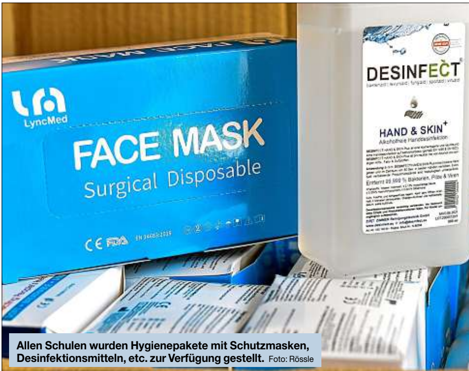
Allen Schulen wurden Hygienepakete mit Schutzmasken, Desinfektionsmitteln, etc. zur Verfügung gestellt.

Der Betrieb an den Schulen und in den Kitas ist wieder angelaufen