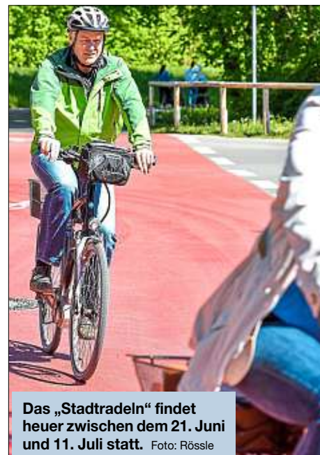
Das „Stadtradeln“ findet heuer zwischen dem 21. Juni und 11. Juli statt.

Die Kilometereintragungen sind aber auch über die „Stadtradeln-App“ (Android, iOS) möglich. Die Radkilometer können dort eingegeben werden oder via GPS-Funktion aufgezeichnet werden. Die Stadtradeln-App führt dabei die exakte Route auf und berechnet die zurückgelegten Kilometer. Jeder Teilnehmer kann so viel und oft radeln wie er will – auch wenige Kilometer bringen das Gesamtergebnis der Stadt Ingolstadt voran. Aber natürlich sind auch Radler ohne Internetzugang nicht von der Teilnahme ausgeschlossen. Sie können sich telefonisch unter der Nummer (0841) 305-2350 oder (0841) 305-2351 registrieren lassen und ihre geradelten Kilometer telefonisch an das Koordinationsbüro durchgeben. Da nicht abzusehen ist, wie lange die angespannte Gesundheitslage noch dauern wird, bitten wir Sie, sich regelmäßig bei den offiziellen Stellen zur Einschätzung der Risikolage zu informieren. Halten Sie sich bitte an die Empfehlungen und Vorgaben. Über alle Neuigkeiten zum „Stadtradeln“ wird auf der Website www.stadtradeln.de/ingolstadt sowie in den sozialen Medien informiert.