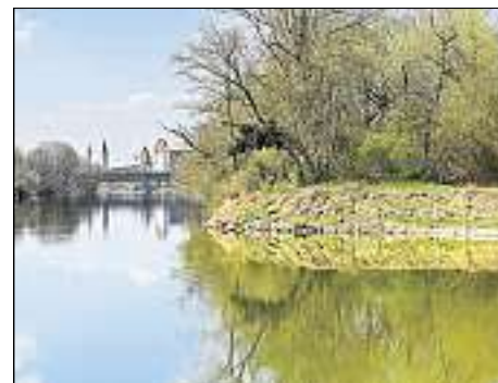
Die Donau durchfließt Ingolstädter Stadtgebiet auf rund 14 Kilometern Länge.

Zwei Mitglieder der „DANUBEPARKS“, des Netzwerks der Donau-Schutzgebiete, haben jetzt einen entsprechenden Förderantrag gestellt: Neben dem ungarischen Duna-Ipoly-Nationalpark, der die Donau mit den Karpaten verknüpft, ist auch Ingolstadt als Schnittstelle zwischen Alpen und Donau dabei. „Unabhängig von einer Entscheidung über einen Donau-Auen-Nationalpark wird dadurch die Wahrnehmung Ingolstadts auf nationaler und europäischer Ebene gestärkt. Auch die Umsetzung des städtischen Projekts ‚Stadtpark Donau‘ wird von dieser transnationalen Zusammenarbeit profitieren“, betont Ebner. Eine endgültige Entscheidung der EU über die Förderung wird bis Mitte des Jahres erwartet. Die Projektlaufzeit beginnt im September und geht über ein Jahr.