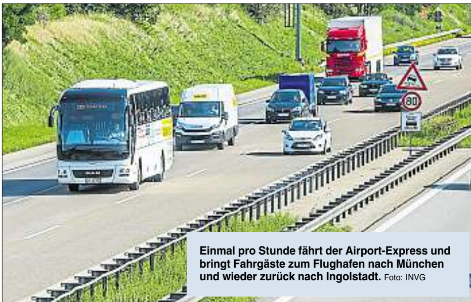
Einmal pro Stunde fährt der Airport-Express und bringt Fahrgäste zum Flughafen nach München und wieder zurück nach Ingolstadt.

Ingolstädter Airport-Express beförderte im Jubiläumsjahr 2017 mehr als 140 000 Fahrgäste