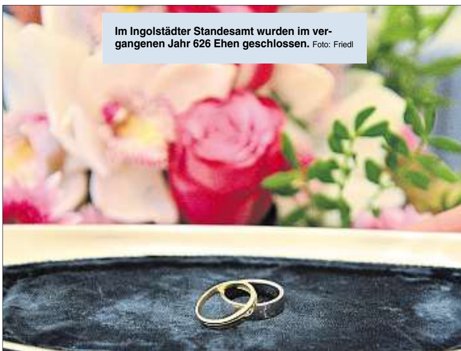
Im Ingolstädter Standesamt wurden im vergangenen Jahr 626 Ehen geschlossen.

Für das vergangene Jahr kann das Ingolstädter Standesamt wieder neue Rekordzahlen verzeichnen: Es sind so viele Kinder auf die Welt gekommen wie nie zuvor. Auch die Zahl der Eheschließungen bewegt sich auf dem höchsten Niveau seit dem Jahr 2000. Bei den Sterbefällen wird der zweithöchste registrierte Wert verzeichnet. Zum letzten Mal erfasst werden die Zahlen der sogenannten Lebenspartnerschaften, die es seit Oktober 2017 nicht mehr gibt.