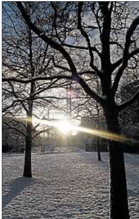
An den Feiertagen geöffnet: Als wichtiger Energielieferant ist die MVA auch über Weihnachten in Betrieb.

Schließlich muss sich jemand für die anderen Teammitglieder „opfern“, damit das Kraftwerk MVA an Weihnachten nicht ausfällt und damit vielleicht an den Christbäumen vieler anderer Menschen die elektronische Lichterkette ausfallen und der Ofen mit dem Weihnachtsbraten ausge-