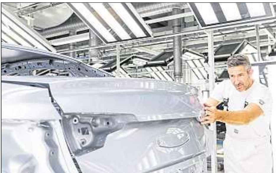
Ingolstadts Wirtschaft ist sehr gut – dank großer Firmen wie Audi, aber auch Mittelständler, Handwerker und Arbeitnehmer haben einen großen Anteil daran.

Die niedrige Arbeitslosenquote, der Bedarf an Wohnraum und die enormen Steuererhöhungen bei der Einkommenssteuer haben es schon vermuten lassen – doch jetzt gibt es den Beweis: Ingolstadt liegt im bundesweiten Städtevergleich ganz vorne! Für den jährlichen Städtetest haben die Zeitschrift „WirtschaftsWoche“, das Portal „ImmobilienScout24“ sowie die „IW Consult“ alle 70 kreisfreien Städte mit mehr als 100.000 Einwohnern analysiert – und dabei vor allem die Bereiche „Standortqualität“, „Wirtschaftskraft“ und „Zukunftsperspektiven“ unter die Lupe genommen.