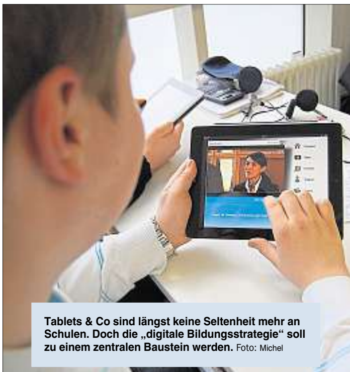
Tablets & Co sind längst keine Seltenheit mehr an Schulen. Doch die „digitale Bildungsstrategie“ soll zu einem zentralen Baustein werden.