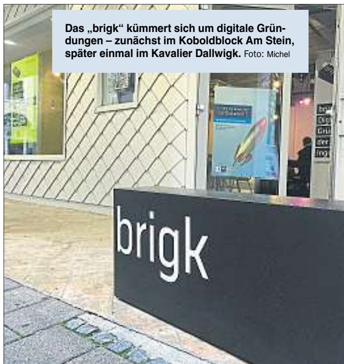
Das „brigk“ kümmert sich um digitale Gründungen – zunächst im Koboldblock Am Stein, später einmal im Kavalier Dallwigk.

steht im Mittelpunkt“, betont Lösel. Ein zentraler Baustein könnte eine durchgängige „digitale Bildungsstrategie“ werden, die von den Kitas beginnend über die Grundschulen, die weiterführenden Schulen, die Berufsschulen, die Volkshochschule bis hin zu den Hochschulen reicht. Auch Stichwörter wie „digitale Teilhabe“ und „digitale Inklusion“ sollen in diesem Kontext diskutiert werden.