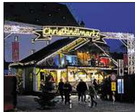
Der Christkindlmarkt auf dem Theatervorplatz hat wie gewohnt bis 23. Dezember geöffnet.

Für Krippenfreunde wird es heuer be-sonders interessant, denn der Ingolstädter Krippenweg wird bereits zum 20. Mal durchgeführt und zu diesem kleinen Jubi-läum werden noch mehr schöne Stücke in den Kirchen und Ausstellungsräumen prä-sentiert. Die Ausstellung von Weihnachts-krippen verschiedener Zeitepochen und Stilrichtungen in den Kirchen und Museen der Stadt kann auf eigene Faust oder im ge-führten Rundgang „Kumm, geh’ ma Krip-perl schaugn...“ (siehe rechte Seite) er-kundet werden. Den Status eines „Ge-heimtipps“ hat inzwischen auch der Kunst-handwerkermarkt „Klein aber fein“ auf dem Carraraplatz hinter sich gelassen. Schließ-lich hat sich schon herumgesprochen, dass an den vier Adventswochenenden zwi-schen Herzogskasten und Kurfürstlicher Reitschule an den weihnachtlich ge-schmückten Hütten fantasievolle und hochwertige Produkte angeboten werden. Dabei sind an jedem Adventswochenende wechselnde Anbieter zu Gast. Der Markt hat freitags von 15 bis 21 Uhr, am Sams-tag von 11 bis 21 Uhr sowie am Sonntag zwischen 11 und 20 Uhr geöffnet.