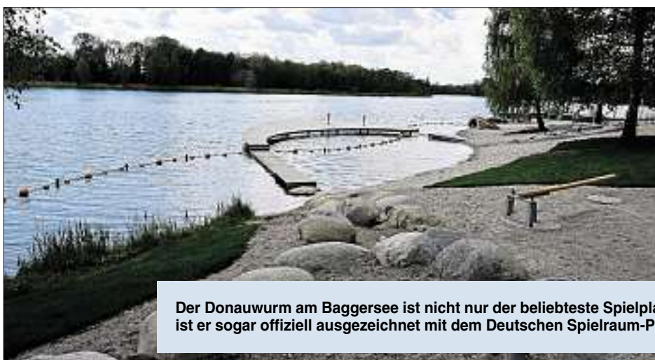
Der Donauwurm am Baggersee ist nicht nur der beliebteste Spielplatz der Stadt – nun ist er sogar offiziell ausgezeichnet mit dem Deutschen Spielraum-Preis.