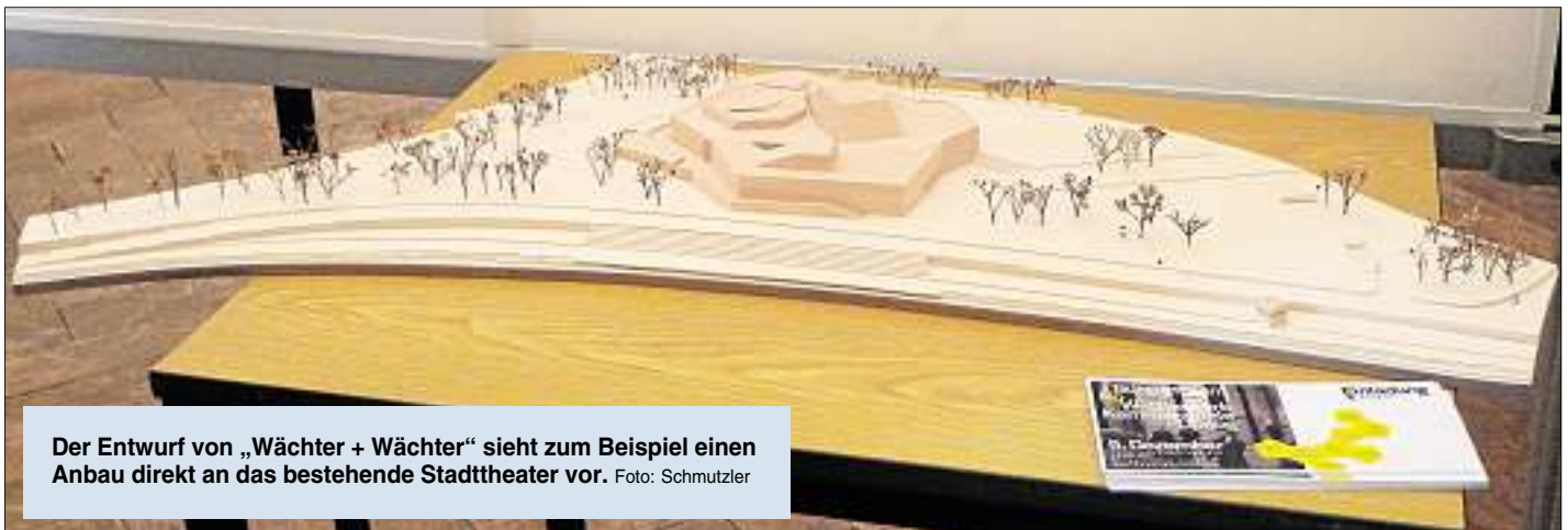
Der Entwurf von „Wächter + Wächter“ sieht zum Beispiel einen Anbau direkt an das bestehende Stadttheater vor.

Wo im Umfeld des bestehenden Stadttheaters könnten die Kammerspiele realisiert werden? Das war die zentrale Frage der städtebaulichen Untersuchung der Standortfrage als erste Planungsstufe für den Bau der Ingolstädter Kammerspiele. 13 internationale Architekturbüros haben sich beteiligt und Entwürfe abgegeben. Das Preisgericht, bestehend aus Vertretern der Stadtverwaltung, Stadträten und Architekten, hat nun vier Varianten ausgewählt, die besonders überzeugten. Die Entwürfe von neun Architekten, die alle samt einen Bau östlich des Bestandsgebäudes vorsahen, kamen hingegen nicht zum Zug. Nach der Entscheidung des Preisgerichts für die Siegergruppe wird die Stadt nun in einen ausführlichen Dialog mit den Bürgern über die Entwürfe treten. Das Planungsreferat bietet dazu zusammen mit dem Kulturreferat in Kooperation mit dem Stadttheater mehrere öffentliche Veranstaltungen an.