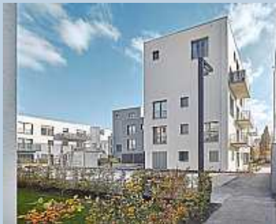
Wohnungsmarkt GWG bietet viele Möglichkeiten für Mieter an