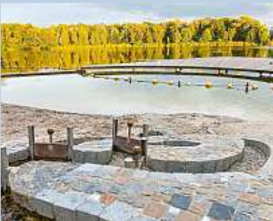
Ein längerer Wurm Wasserspielplatz am Baggersee wird erweitert