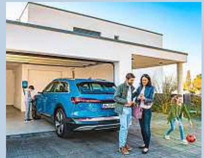
Zukunftsthemen Elektromobilität steht bei SWI Netze im Fokus