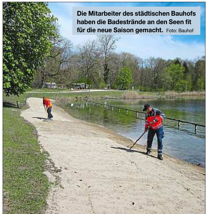
Die Mitarbeiter des städtischen Bauhofs haben die Badestrände an den Seen fit für die neue Saison gemacht.